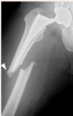
Obr. 5 | Periprotetická zlomenina s radiologickým obrazem atypické fraktury femuru. Upraveno podle [6]