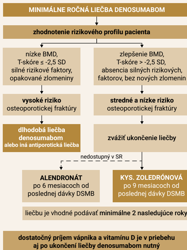
Schéma | Algoritmus liečby denosumabom

Prínos liečby je aj u pacientiek s osteoporózou a vysokým rizikom karcinómu prsníka. Liečba nie je vhodná u pacientiek s klimakterickým syndrómom a s rizikom tromboembolizmu. Dávkovanie, spôsob podania a kon-